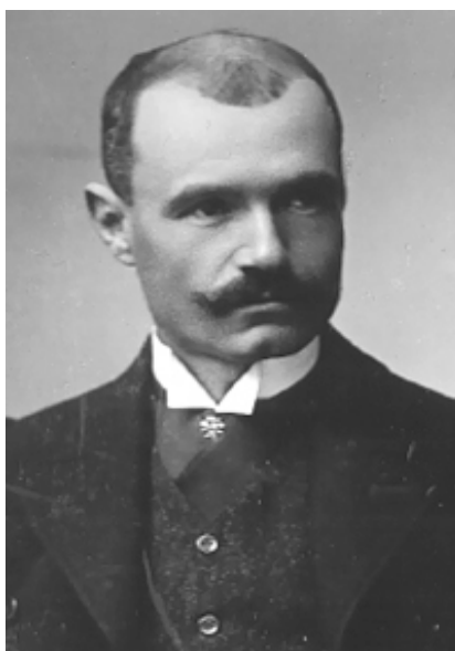
Michel Pétrovitch (1868-1943)

Son éclipse durable (mais pas totale) en France et dans le monde de la francophonie est d'autant plus étonnante qu'il vécut plusieurs années à Paris et que ses premiers travaux furent rédigés en français. Je proposerai donc un bref aperçu de son aventure 6 ainsi qu'un panorama de ses multiples centres d'intérêt et des succès qu'il y rencontra. D'autres suivront, je l'espère.